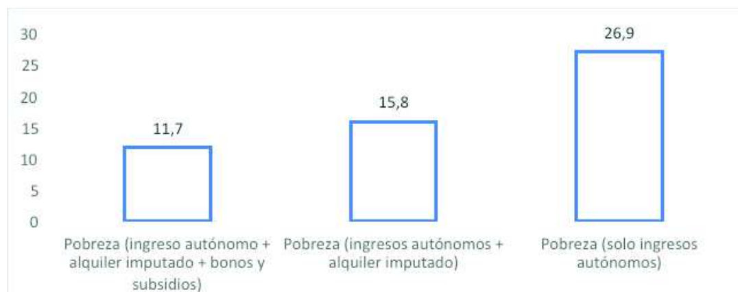
Gráfico 1. Porcentaje de personas bajo la línea de pobreza. Casen 2015