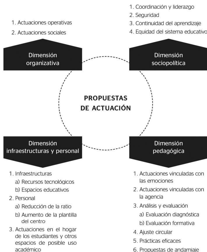
Figura 2. Síntesis de propuestas de actuación para el reinicio del año lectivo.

Otro trabajo (Trujillo-Sáez et al., 2020) sugiere una síntesis de medidas para la reapertura de escuelas, 16 agrupadas en cuatro dimensiones o ámbitos. La dimensión sociopolítica hace referencia al ámbito de acción ministerial y enfatiza la importancia de la coordinación y el liderazgo de una estrategia nacional, el aumento de las inversiones y recursos en las escuelas, la definición de protocolos de acción, el fortalecimiento de los apoyos profesionales en cada unidad educativa, la capacitación intensiva a docentes y personal de las escuelas en materias sanitarias y de prevención de contagios, la articulación del sector educación con autoridades, servicios locales y ONG, el apoyo a las familias en sus propias comunidades que garantice el cumplimiento de umbrales de bienestar en sus hogares.